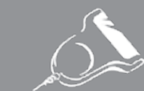
Scanner (alimenté par la balance)